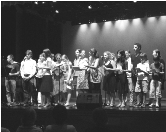
Бисер перед Свиньей