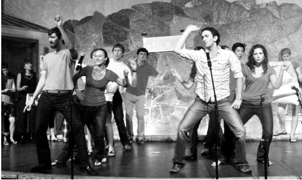
Пятый курс поет «Все, что в жизни есть у меня» на вечере Караоке